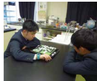
マインドスポーツ・サイエンス部