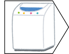
洗濯機で洗う 家族の洗濯物とは 区別して洗う