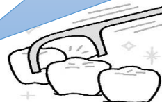
歯と歯の間は、歯間ブラシを上手に活用