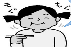
かむと唾液が出てむし歯予防