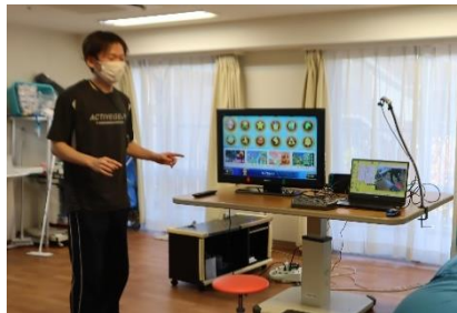
障害者でも利用しやすいスイッチを取り入れたテレビゲームです。