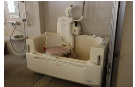
機械浴の浴槽です。臥位タイプもありました。