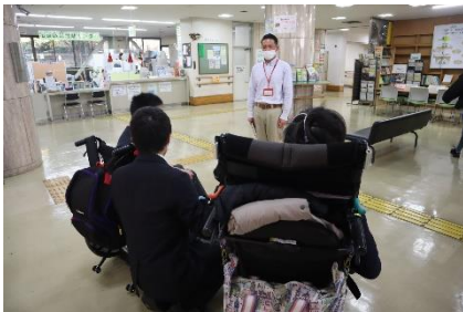
見学前にしっかり挨拶しました。

まさに「百聞は一見に如かず」で、将来の自分の姿を想像してみることができた貴重な機会となりました。今回の知見を活かして、「日々元気に登校をすること」、「よりよい気持ちの伝え方」、「どんな人の介助も受けられる力」、「自分でできることは自分から取り組む気持ち」などを今後の学校・家庭生活の中で高めていくことが必要です。今後も引き続き「豊かな生活づくり」に向けて準備を進めていきましょう。